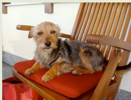
Billy au plus profond du bonheur dans le fauteuil de sa nouvelle maîtresse.

Dans un premier temps, Billy l'ignore et continue de vivre selon ses mauvaises habitudes. Mais bien vite tout va changer dans sa vie!